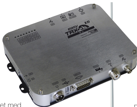
A146-SF21 hovedenhet med Galaxy 5396 - AIS antenne

Enheten trenger ingen installasjon til sjøs, ute på anlegget VAtON transmitteren monteres på land eller på annen fast installasjon i AIS området. Navigasjonsmerkene kan sees av skipstrafikk som nærmer seg fra 10-25nm avhengig av anteneplassering og landskap. Tilkobles egnet stabil strømforsyning og tilhørende AIS antenne