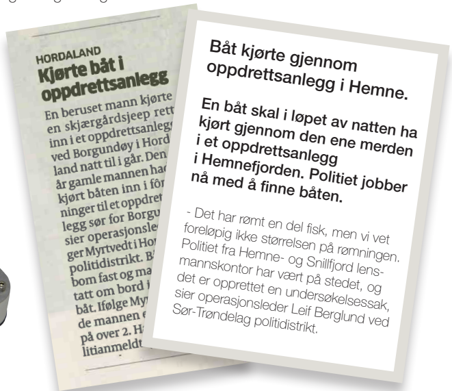
Faksimile Aftenposten, 3. juni 2012

Be om ytterligere informasjon og pris på tilpassede løsninger og konfigureringer